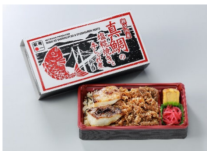
瀬戸内産真鯛の塩糍焼きと 牛しぐれ煮弁当 1,080円(税込)