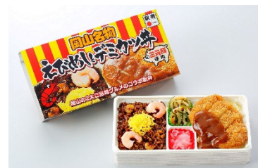
岡山名物 えびめしとデミカツ丼 950円(税込)