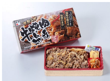
スタミナ牛焼肉弁当 900円(税込)