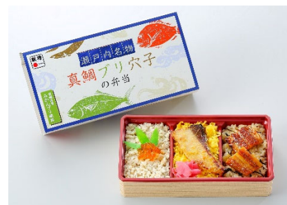
瀬戸内名物真鯛ブリ穴子の弁当 1,100円(税込)