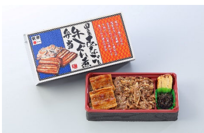
国産あなごと牛しぐれ煮弁当 1,180円(税込)