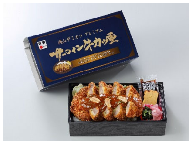
岡山デミカツプレミアム サーロイン牛かつ重 1,280円(税込)