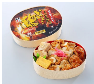
いいとこ鶏弁当 900円(税込)