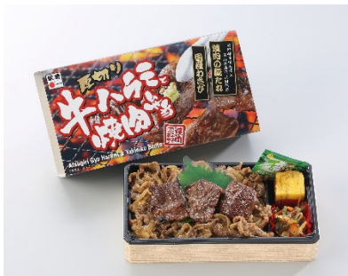
厚切り牛ハラミと焼肉弁当 1,080円(税込)