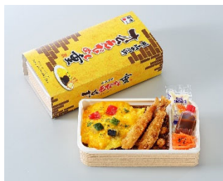
岡山名物オムえびめし重 880円(税込)