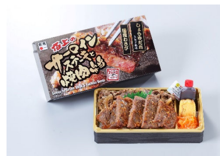
極上のサーロインステーキと 焼肉弁当 1,200円(税込)